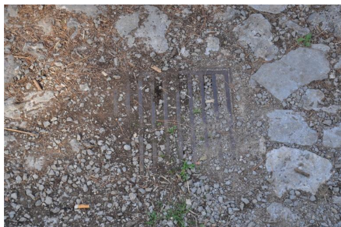
Liberare da detriti e terriccio le caditoie lungo il camminamento