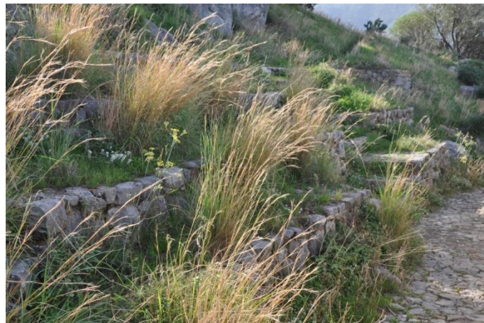
Ripulire la scala e le gradinate nell'area dei 5 Pizzi